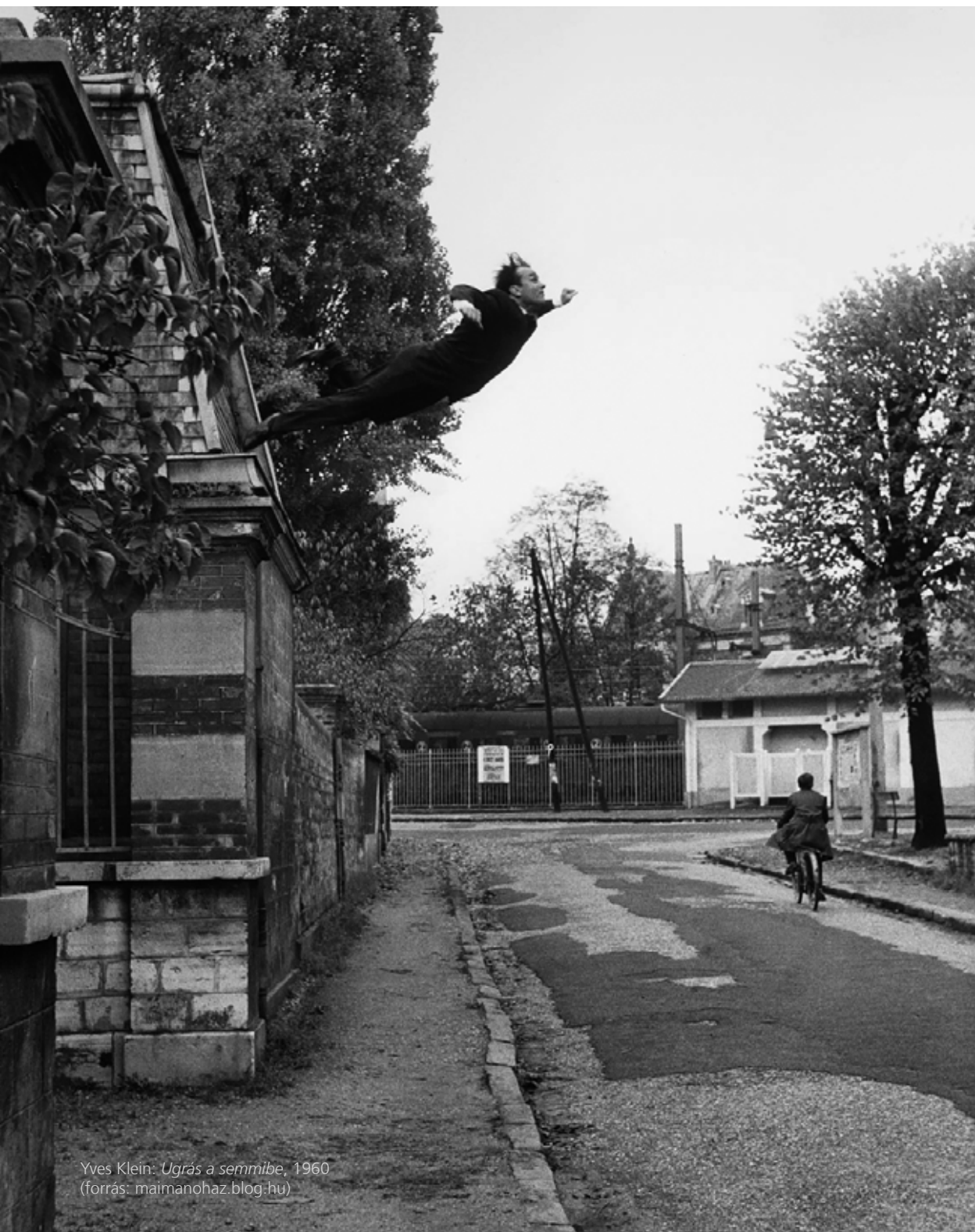
Yves Klein: Ugrás a semmibe , 1960