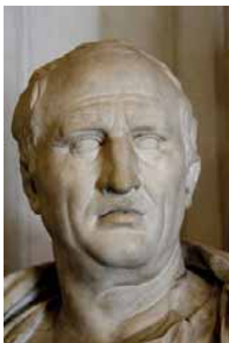
Marcus Tullius Cicero (Kr. e. 106–43)

tek), az a Halál. A Halál az előttem álló fénykép eidosza. (...) Ugyancsak furcsa módon, számomra a fényképpel társuló testrész nem a szem (ez elretent), hanem az ujj: ami az objektívet működésbe hozza, ami elindítja a lemezek fémes kattogását”. 10