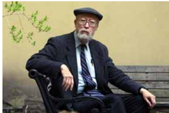
Marvin Carlson egy Sanghajban készült felvételen

Elvégre mi mást csinál az irodalmi színház, minthogy emlékezik az irodalmi kánonba került dramatikus szövegekre, és közönségével együtt konfrontálódik a kortárs szövegekkel? Akár régi, akár új drámákkal, folyamatosan felmutatja egy csoport önmagáról alkotott bizonyos képét, például a polgárságét, amely a jelen horizontjában vizsgálja felül és kérdőjelezi meg önmagát. A csoport konstitutív