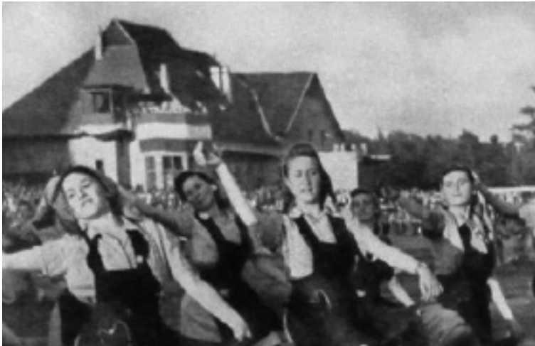
2. kép. A Szakszervezeti Ifjómunkás- és Tanoncmozgalom táncos bemutatója: „Dalol a munka”