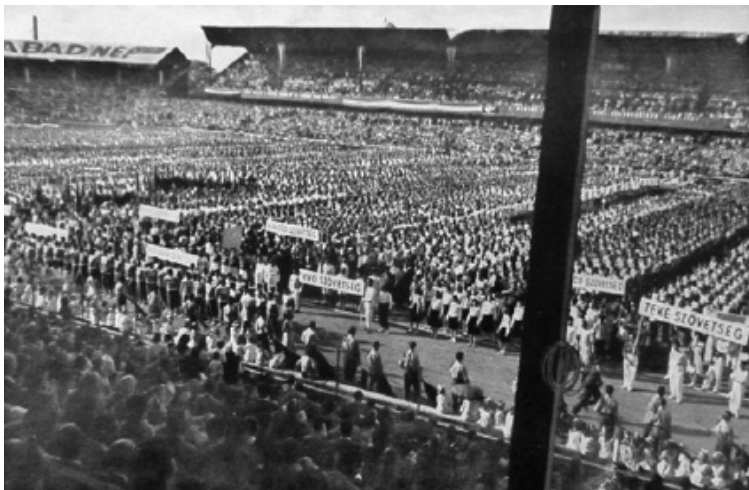
1. kép. 16 ezer sportoló fiatal a Ferencvárosi Torna Club pályáján