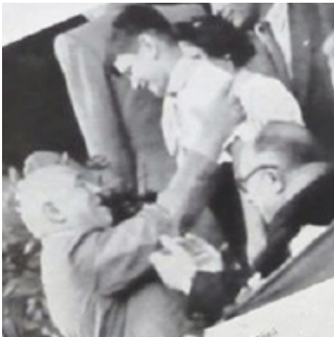
3. kép. Egy úttörő virággal köszönti Rákosi Mátyást