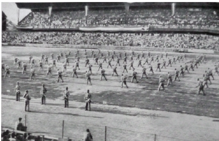
5. kép. Rendőrsportolók építési munkák mozdulatait imitálják a Ferencvárosi TC pályáján