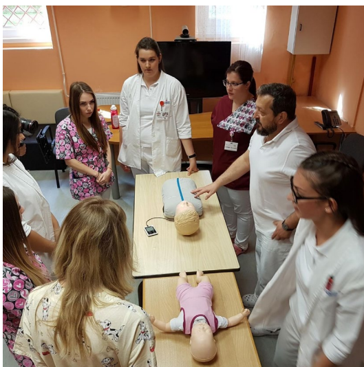
1. kép. Főszerepben hétköznapi hőseink: (oktató) ápolóink. 2

azért, hogy az ápolást – mint művészetet és tudományt – magas színvonalon tudják művelni és a későbbiekben továbbadni. Az ápoló művészi munkája abban nyilvánul meg, hogy milyen kapcsolatot tud teremteni a betegével, mennyire tud ráhangolódni az egyén érzéseire, milyen módon képes segíteni, ápolni a betegét, és az emberi kapcsolatokat hogyan használja fel, melyek által gyógyító közeget képes teremteni a betege számára. Folyamatos tanulóssal és tanítással tudjuk az ápolói hivatást egy magasabb és méltó szintre, megérdemelt helyre emelni. Ezzel a szemlélettel integráljuk hallgatóinkat az ápolásszakma rejtjelmeibe és szépségébe.