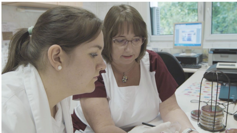
2. kép. Főszerepben hétköznapi hőseink: (oktató) ápolóink. 4

valós élet gyakorlatába átültessék. Kiemelkedő fontossággal bír számunkra, hogy megfelelő számú és magas szakmai tudással rendelkező, stabil szakdolgozói közösség megteremtését támogassuk. Az intézet hírnevének, presztízsének fokozása, is célunk volt az oktató ápolói rendszer kialakítása során, ezáltal az ápolói utánpótlást biztosítjuk kórházunkban.