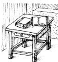
Van két könyv az asztalon.

There _____ one desk in the classroom. There _____ five chairs in the classroom. There _____ a cat in the garden. There _____ two children at the bus stop. There _____ milk in the fridge. There _____ three apples on the table.