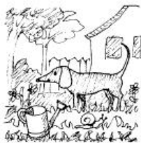
Van egy kutya a kertben.