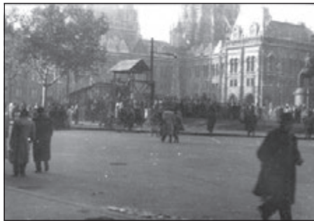
A tömegben az Astoriától érkező egyik harckocsi látható 23