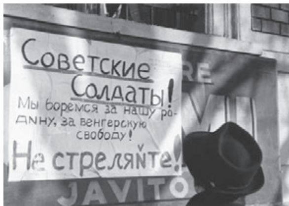
„Szovjet katonák! Mi a népünkért és a magyar szabadságért harcolunk!”

A tüntetés, a sortűz körülményei a fentieket is figyelembe véve a következő módon rekonstruálhatóak. Az egyetemi hallgatók kezdeményezte demonstráció résztvevői a Kossuth Lajos utcából, az Astoria Szálló elől indultak el, és útközben csatlakoztak hozzájuk a budapesti pályaudvarokról beérkező peremkerületi munkások, akik a tömegközlekedés részleges működése miatt nem tudtak a munkahelyeikre eljutni. A tüntető diákok tömegét növelték a gyalogosan munkába igyekvő fővárosiak is.