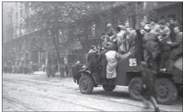
Tüntetők gyülekezése az Astoriánál és útban szovjet harckocsikon és egy BTR-152 páncélozott szállítójárművön a Parlamenthez 21