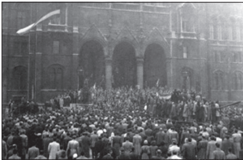
Békés tüntetők csoportosulása a Kossuth téren 22