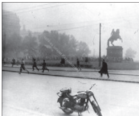
A lövések elől menekülő tüntetők a Kossuth téren 49

Szembejött velem egy idősebb férfi feltartott vérező kézzel, az ujjai voltak ellőve. Az FM alagsorában lévő színházterem tele volt emberekkel. Az FM épülete mögötti utcára kinyitottak egy kijáratot, amin keresztül távoztak az emberek. Miután a tüzelés a téren abbamaradt, szomorú látvány tárult az emberek elé, mindenütt halott és sebesült emberek, feküdtek. A Rákóczy szobor FM felé eső oldalánál egy idős asszony, mellette egy gyerek valószínűleg egy nagymama és unokája, mellettük egy gyékény szatyor, amiből krumpli és hagyma ömlött ki. Alaposan körülnéztem, de sehol egy civil fegyverest nem láttam, csak zárt szovjet harckocsikat. A parlament előtt halottak között fel lehetett ismerni egy pár szovjet katonát is. 50