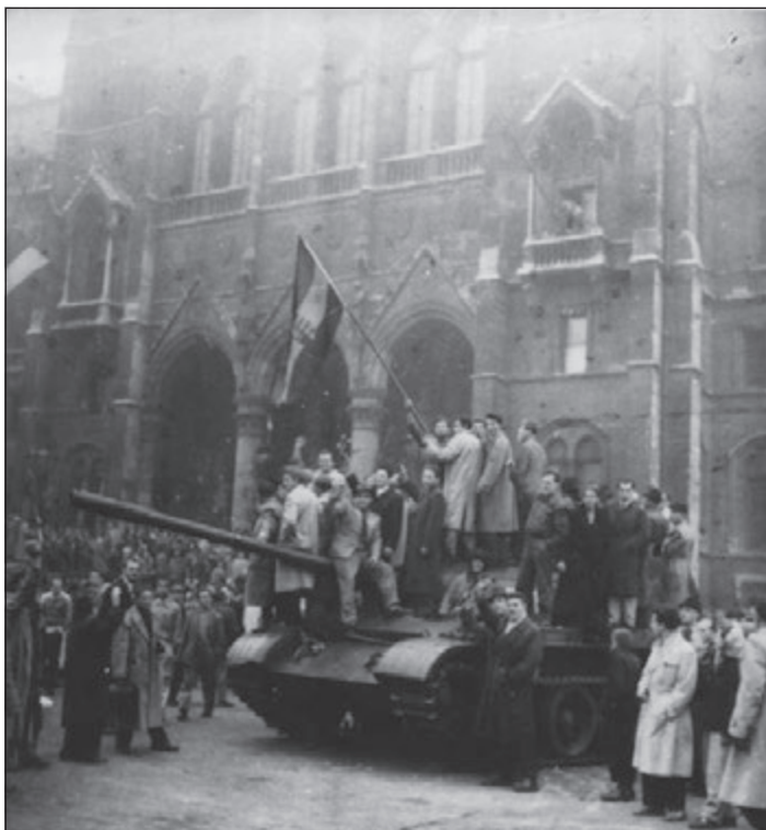
A tüzmegegyítés előtti percek: a harckocsin Kossuth címeres zászlót lengető szovjet katonákkal barátkozó magyarok 24