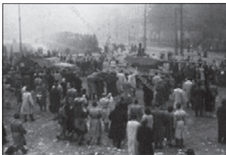
A szovjet harcokosi és páncélos szállító jármű a Ságvári [Vértanúk] tere irányában távozik 48

Az első sorozat után a parlament előtt álló harcokosik legénysége közül azok, akik kint álltak és egy csomó civil találatot kapott és a földre rogyott. Az emberek földre vetették magukat. Mikor a tüzelés abbamarad, fölpattantak és futni kezdtek az FM épülete felé. Mikor ismét elkezdtek tüzelni, megint a földre vetették magukat, majd a tűzszünetben felpattanva ismét futni kezdtek. Három vagy négy nekifutással a tömeg velem együtt beért az FM árkádjá alá, ahol már egy csomó ember feküdt. Az a harcokosi, amelyik a Ságvári térnél állt belőtt az árkádok alá. Hallani lehetett a lövedékek tompa becsapódását az emberi testekbe. Az FM főkapuja be volt zárva, nem lehetett bemenni. A parlament elől újabb és újabb emberek futottak be az árkádok alá és ráfeküdtek az ott lévőkre. A tüzelés minden irányból folyt, egyszer csak lerepült a kalapom fejemről, mikor utána nyúltam akkor vettem észre, hogy át van lyukasztva. A fekvő embereken egy fiatal férfi fölrohant a magasföldszint ablakaihoz, egyet berúgott, bement az épületbe és kinyitotta a kaput. Az emberek betódultak az épületbe, ahol a sebesültek próbáltak elsősegély után nézni.