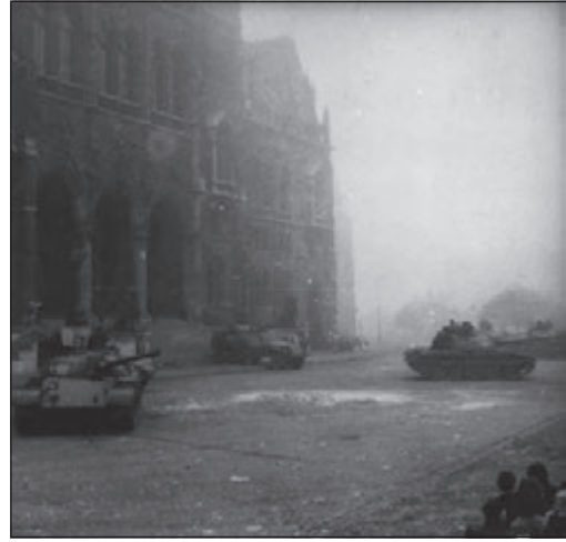
A délutáni demonstráció – „Véres-zászlós tüntetés” – kezdetere a sortűz nyomait mésszel tüntették el 53