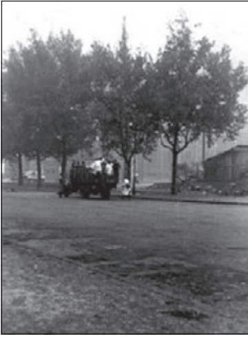
Katonák szállítják el a térről halottakat 52