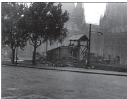
A legtöbb a téren Rákóczi-szobortól nem messze, a Metró-építkezés barakkjánál (ma a 2-es villamos megállója) haltak meg 51