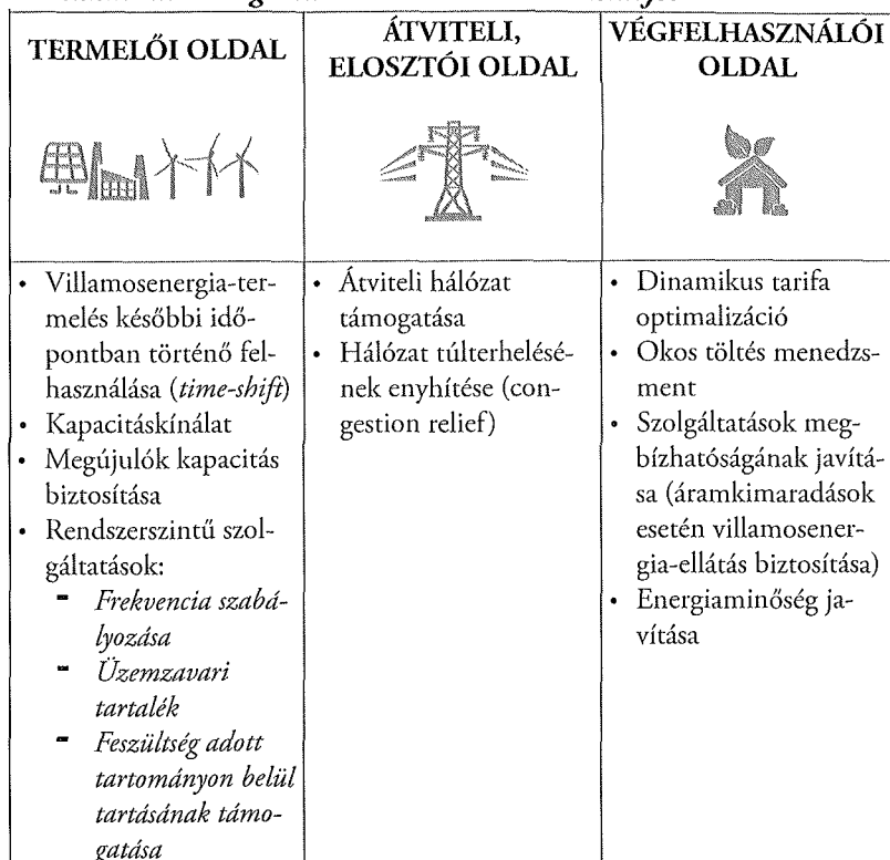
Táblázat 1.: Energiatárolók alkalmazási szintjei

Az 1. Táblázat alapján látható, hogy az energiátároló rendszerek több felhasználói szinten is értékteremtő szolgáltatásokat tudnak nyújtani, így a komplex műszaki rendszer telepítésében és alkalmazásában több piaci szereplő is jelentős mértékben érdekelt lehet: